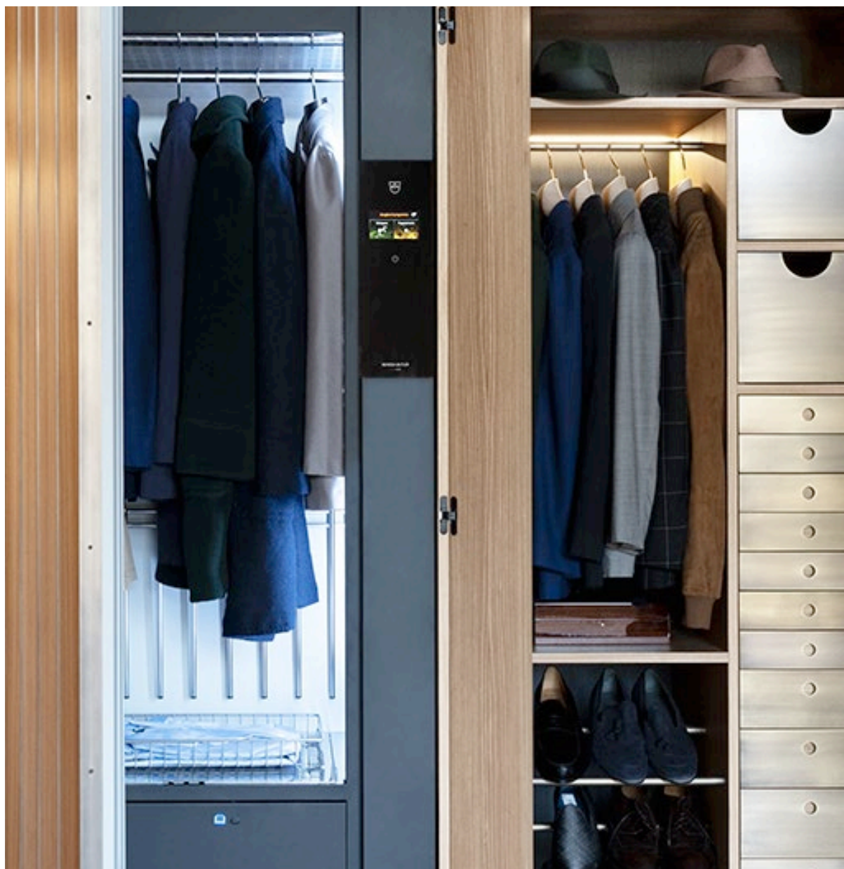
ГАРДЕРОБНАЯ СИСТЕМА СО ВСТРОЕННЫМ REFRESH BUTLER ОТ V-ZUG V-ZUG REFRESH BUTLER WARDROBE